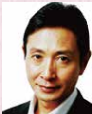
三田村 邦彦氏 (俳優)